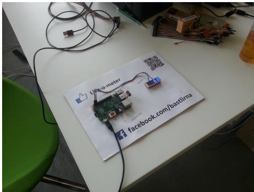
Obrázek 1 – Like-o-meter

Začátkem zimního semestru 2014/2015 se projekt prezentoval na Akci prvák. Vlastní stánek měl také robotický kroužek, kde prezentoval svého soutěžního robota. V rámci celého projektu proběhl den otevřených dveří, který byl propagován také mimo Strahov (FEL, FIT, Karlovo náměstí). Projekt byl oficiálně zapsán do mezinárodního registru elektro – mechanických dílen ( http://hackerspaces.org ). Projekt se také proaktivně zúčastnil několika velkých akcí, kde prezentoval klub jako celek: